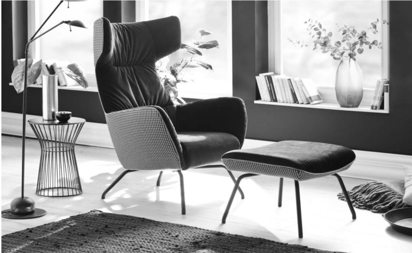
Einzelsessel mit Hocker - Außenkorpus in Classy black, Innen in Velvet black und Keder in Easy Care apple (Variante B)